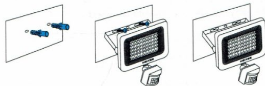
Diagramma di installazione del focus